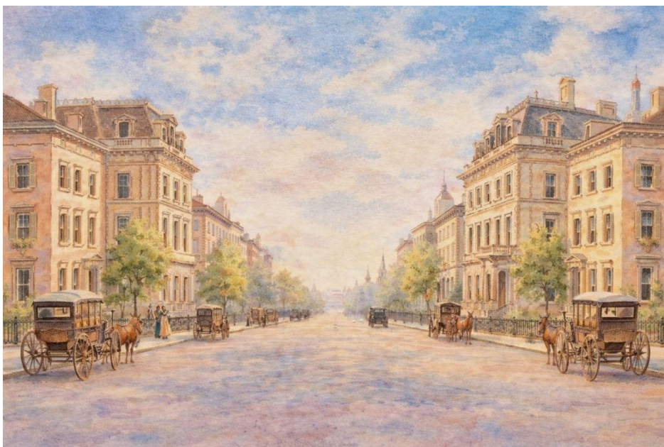
Figura 1. La Quinta Avenida hacia 1870

Nota. Recreación pictórica generada por ChatGPT, con el prompt: “Acuarela de La Quinta Avenida en 1870” (con ajustes propios, abril de 2026).