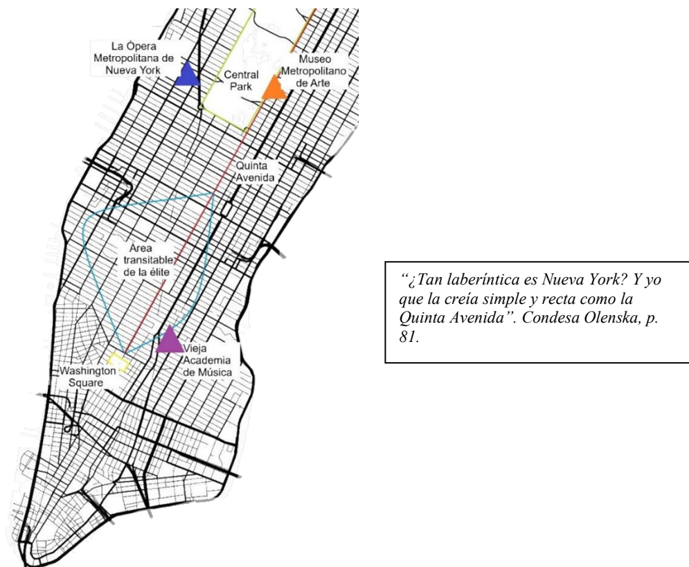
Diagrama 2. Espacialidad de la trama en La Edad de la Inocencia

Nota. Realizado por los autores con base en las principales nomenclaturas de la novela.