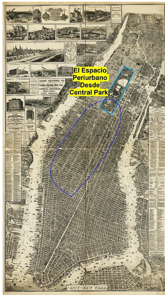
Diagrama 1. El Espacio Periurbano desde Central Park

Nota. The City of New York elaborado por William L. Taylor, en Galt & Hoy, 1879. El sombreado y la anotación es propia.