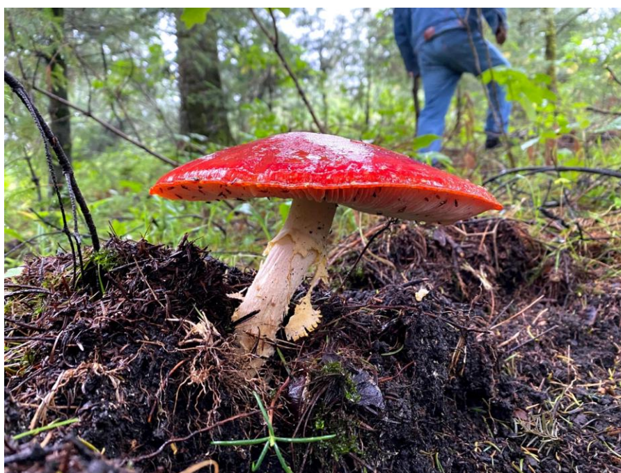
Figura 5. Hongo tóxico conocido como “Matamoscas” durante el recorrido con un honguero de la comunidad de Santa Rosa Xochiac.

ejecutaban principalmente mujeres que iban a recoger algunas ramas o sobrantes a los aserraderos y la llevaban al pueblo para vender como carbón. Como comenta una de la entrevistadas: ‘nada se desperdiciaba’ La tarea de recolección se llevaba a cabo por medio del mecapalli , que consiste en una banda de algodón o de ixtle -fibra del maguey-, sujeta por sus extremos a dos cuerdas que sirven para sostener la carga. La banda protegía la cabeza y el cuello, y al mismo tiempo hacía que la carga se equilibrara y distribuyendo el peso por todos los músculos del cuerpo del cargador. Las prácticas de recolección se organizaron a manera de paquete junto con las de recolección de hierbas medicinales y hongos ya que, durante el trayecto, las leñeras recopilaban plantas y hongos para vender. Esta co-dependencia a la proximidad del aserradero creó un lazo mucho más fuerte con la práctica de recolección de leña, que con la de la recolección de hongos que se continúa realizándose hasta la fecha ya que no dependía de la proximidad del aserradero para ejecutarse (Figura 5).