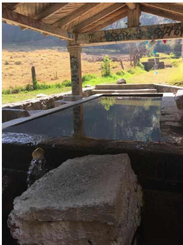
Figura 2. Lavadero cercano al manantial de Espítzo cuyas aguas desembocan al Río Borracho, San Pablo Chimalpa, Fotografía de la autora, 25/02/2017

existen varios manantiales como el de Moneruco , cuya gestión es realizada por mujeres y respetada por los distintos comisariados conformados por una mayoría masculina.