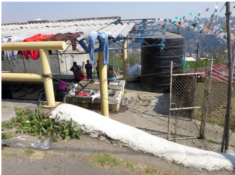
Figura 3. Un grupo de mujeres se reúnen en un lavadero a orillas del Pueblo de San Pablo Chimalpa. 25/02/2017

agua, el nivel de restregado de prenda en relación al uso de ciertos materiales o recursos. Por ejemplo: como saber que tanto tallar sin desgastarla, o como mezclar sustancias para quitar manchas u olores, el proceso de lavado requiere de saberes como cuando exprimirla y como disponerla para su secado. A su vez, lavar la ropa se relaciona con una serie de convenciones y significados que establecen la actividad asociada al valor de 'limpieza', que conllevan una evolución histórica de dicha práctica (Figura 3).