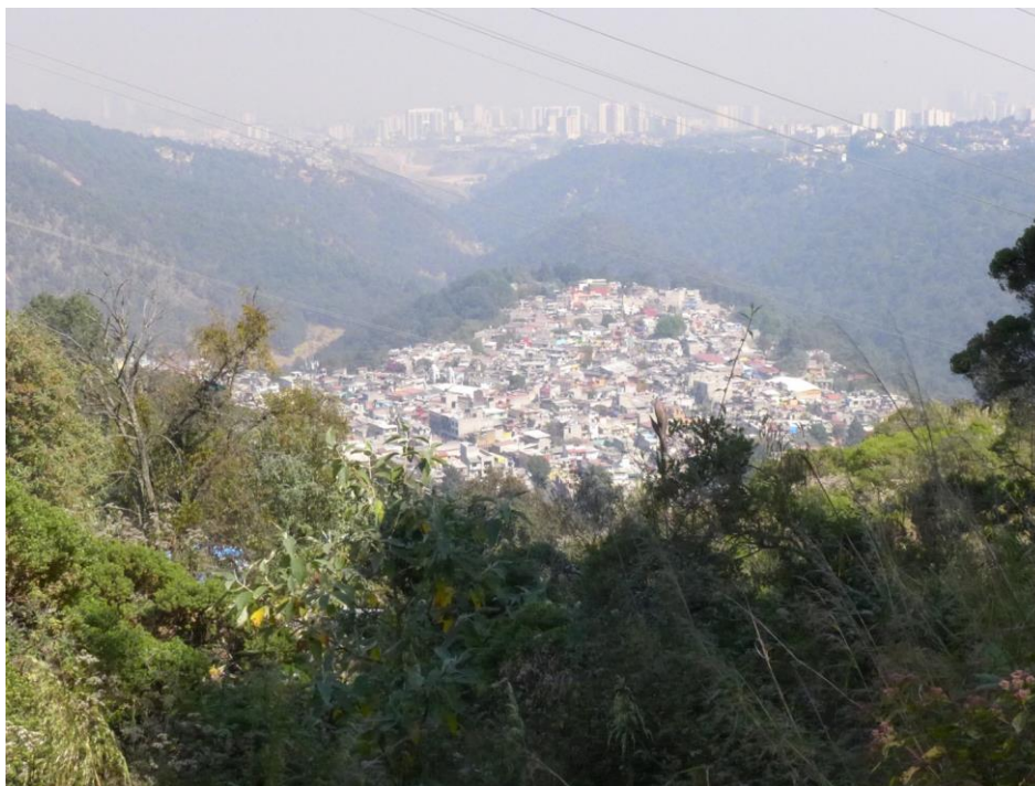
Figura 1. Vista desde el bosque al Pueblo de San Pablo Chimalpa, a lo lejos se puede observar el avance de la mancha urbana. 26/01/2017

gentrificación, así como la discriminación de la sociedad moderna 3 . En su gran mayoría, son descendientes de sociedades indígenas hablantes de náhuatl y otomí y han tratado de mantener sus tradiciones, costumbres y fiestas que conforman un modo de vida sui generis ; así como saberes tradicionales en materia de agroecológica y organización mixta o comunal de la administración de los recursos y propiedad de la tierra.